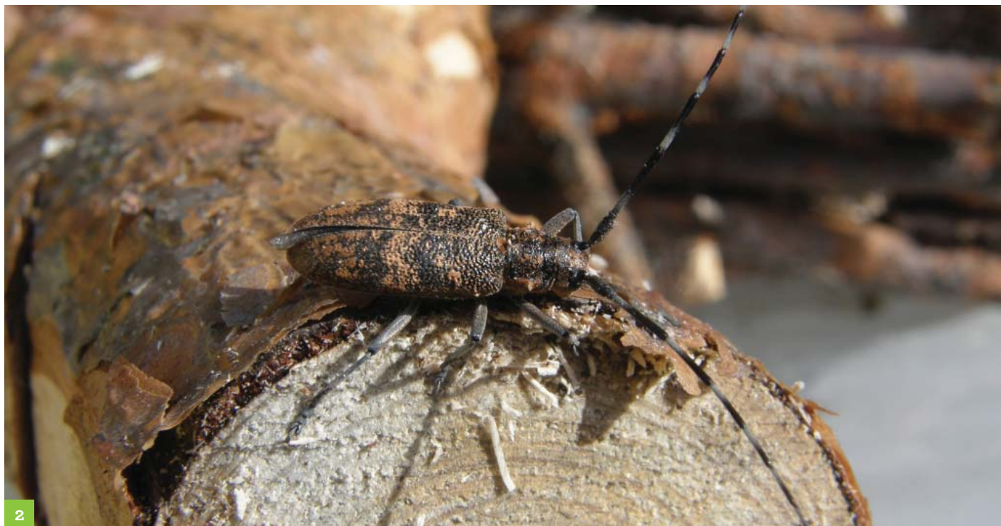
2 Monochamus galloprovincialis , insecto vector do nemátodo do pinheiro.

O insecto vector adulto realiza as posturas nas árvores debilitadas ou cortadas recentemente, hibernando na madeira na fase larvar. Se nesta madeira estiver presente o nemátodo, o mesmo entra no sistema respiratório das larvas do insecto vector. Quando os adultos emergem dirigem-se para as árvores sãs para se alimentarem e, ao transportar consigo os nemátodos, contaminam novas árvores.