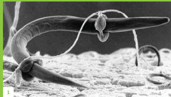
1 Bursaphelenchus xylophilus (Steiner & Buhrer) Nickle et al. visto ao microscópio electrónico.

Segundo a legislação comunitária é um organismo de quarentena, o que obriga os estados-membros afectados a adoptar medidas específicas para o seu controlo e erradicação.