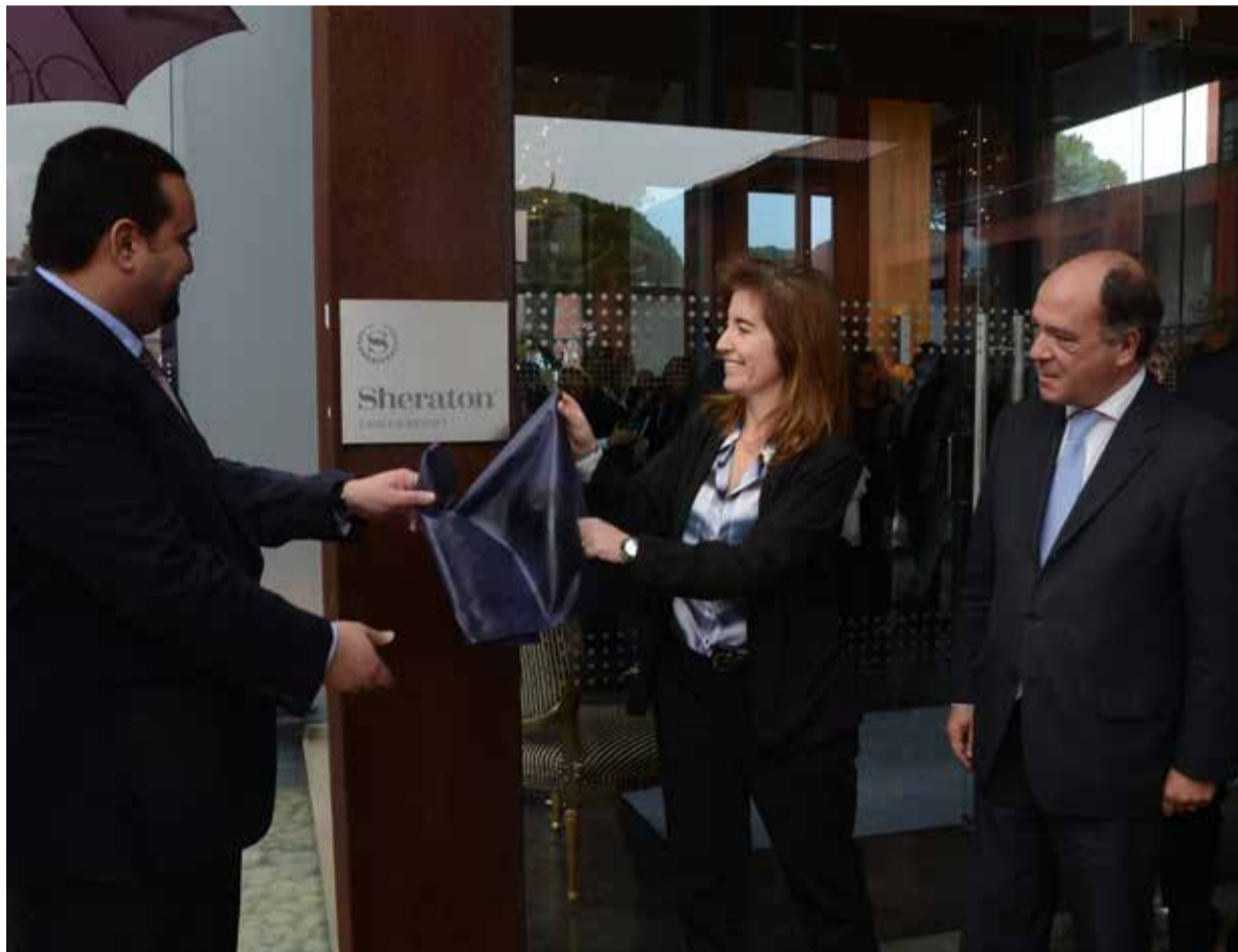
O Sheraton Cascais Resort foi inaugurado em fevereiro de 2016 na presença da secretária de Estado do Turismo, Ana Mendes Coutinho; do presidente da Câmara Municipal de Cascais, Carlos Carreiras e do presidente da Starwood Hotels para a Europa, África e Médio Oriente, Michael Wale

A recente inauguração de unidades hoteleiras no concelho de Cascais representa um investimento no setor turístico, mas é também um barómetro para a economia local e para o emprego. Neste setor específico, o apelo faz-se sentir em todos os segmentos. Também a restauração, o setor imobiliário e o aluguer de automóveis são áreas de negócio que crescem à boleia do turismo.