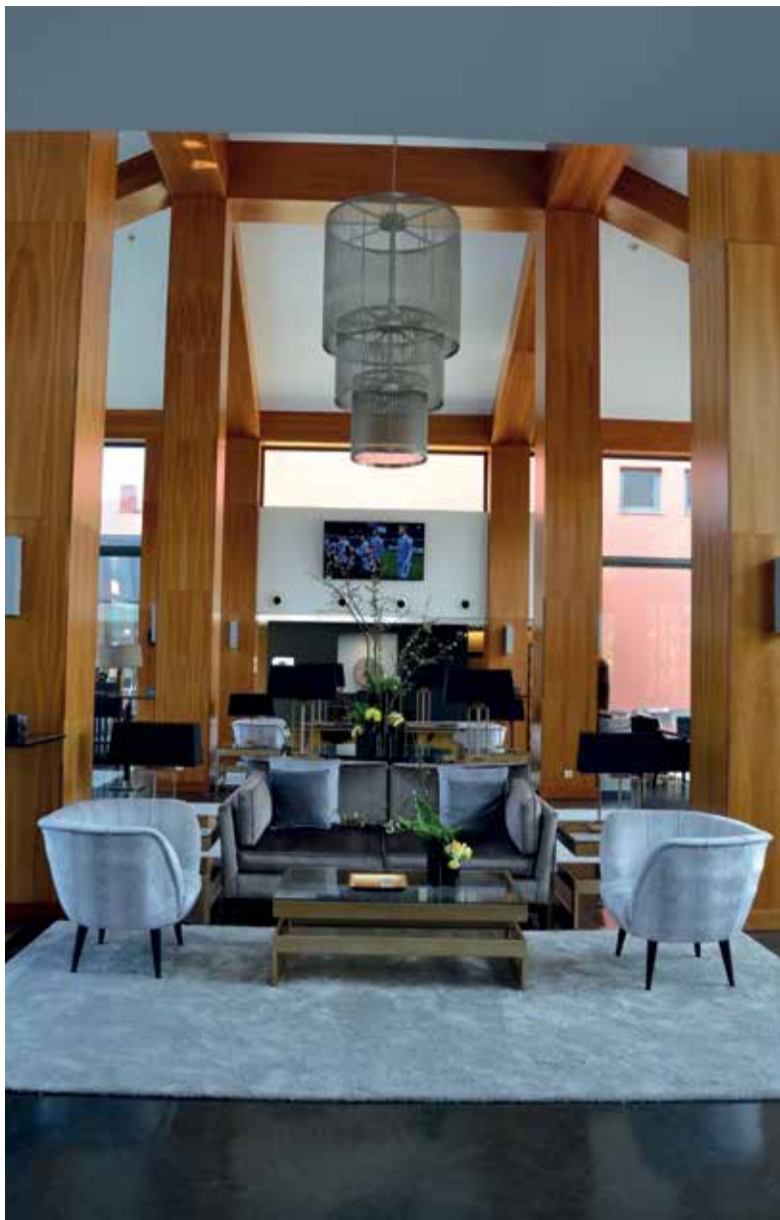
O requinte dá as boas vindas a quem chega ao Sheraton Cascais Resort