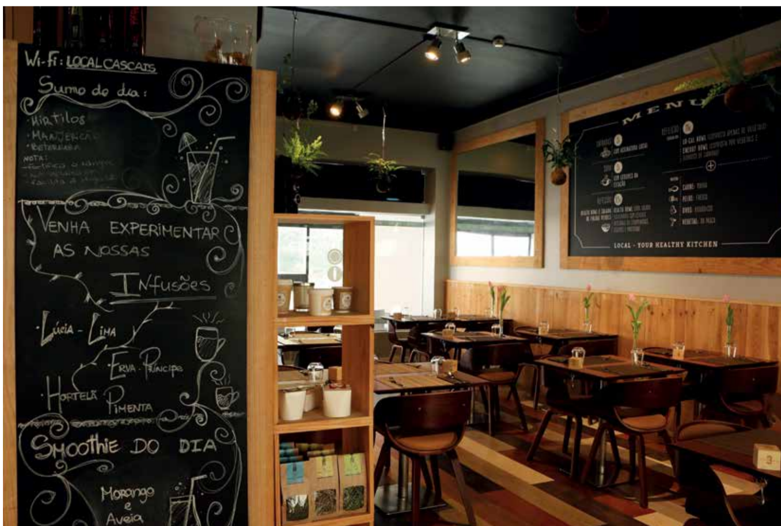
Interior do restaurante “Local – Your Healthy Kitchen”