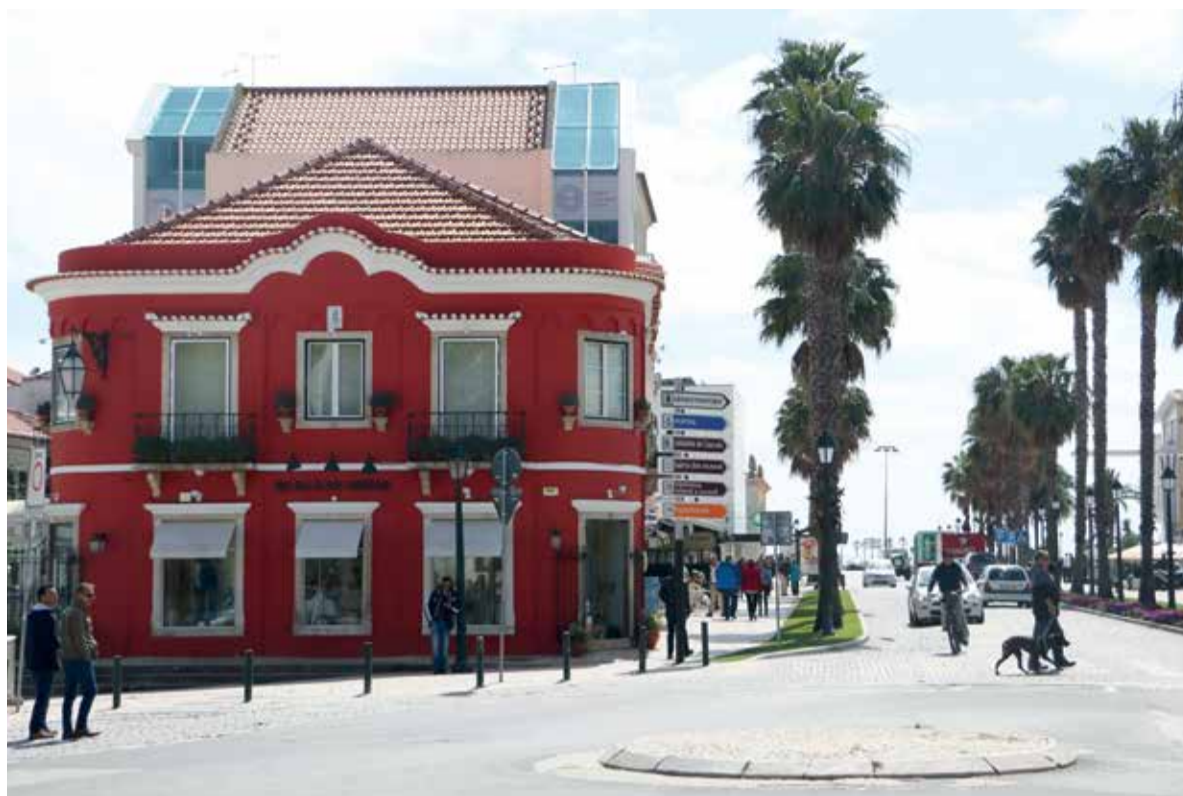
São cada vez mais os turistas em Cascais que dinamizam o comércio tradicional

a ver com um crescimento do número de turistas em Cascais”. Já numa das casas de câmbio contactada na Vila de Cascais, o responsável por uma das operadoras assegura que não há, neste momento, uma estatística que possa levar a conclusões sobre a evolução deste negócio nos últimos meses. Ainda assim, a percepção de quem diariamente trabalha neste negócio é a de que “o movimento não parece ter sofrido grandes alterações”.