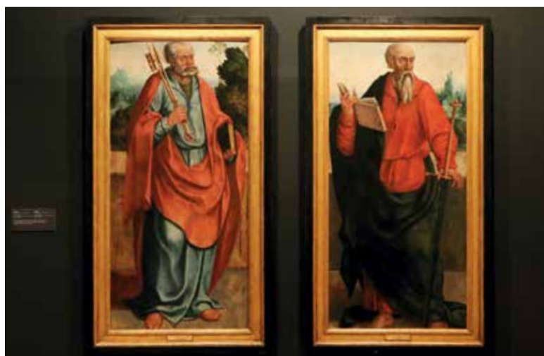
“S. Pedro” e “S. Paulo”, pintura em óleo s/ madeira de Gaspar Vaz, do séc. XVI