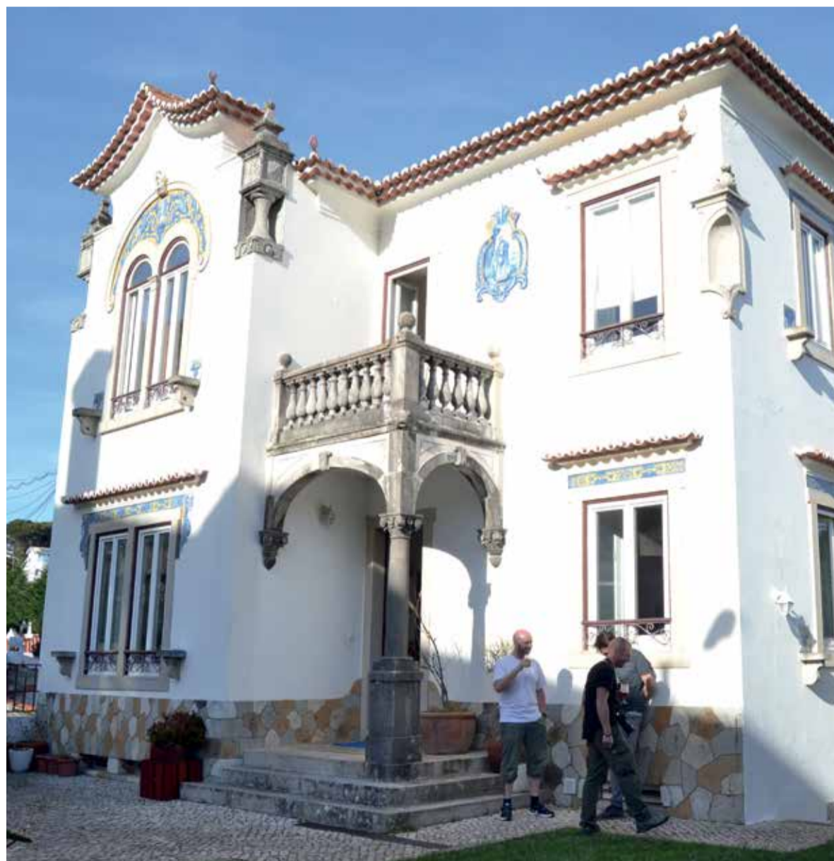
O Salty Pelican Beach Hostel & Surf Camp deu nova vida a um edifício centenário

Cascais é também um concelho de acolhimento para todos e os hostels são prova disso. O Salty Pelican Beach Hostel & Surf Camp foi inaugurado este mês pelo presidente da autarquia, Carlos Carreiras. Um negócio criado por um português, um