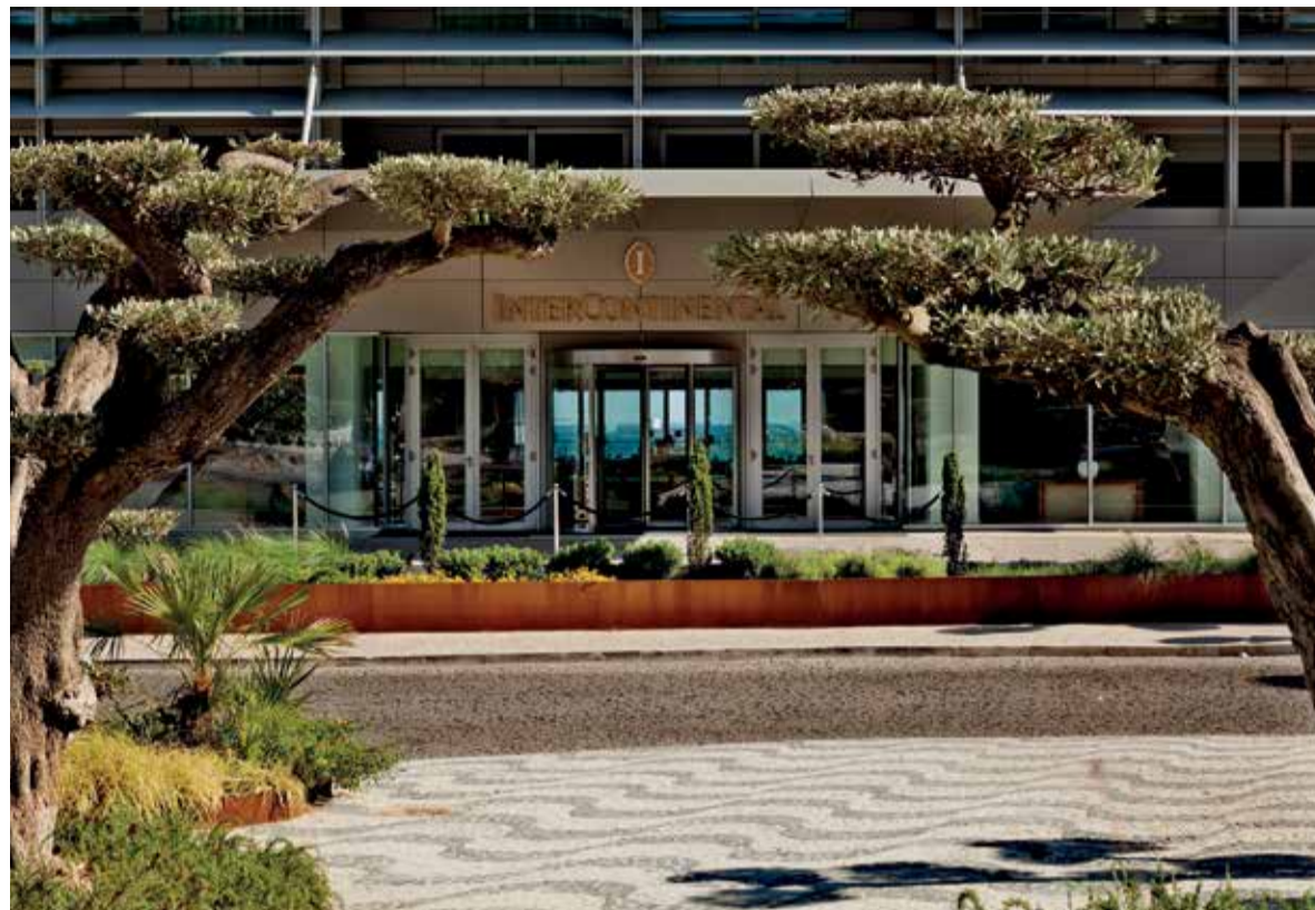
O Intercontinental Estoril veio reforçar a oferta de luxo em Cascais

de posicionar a propriedade”. E, dessa forma, acrescenta, “potenciam a estabilidade ao longo do ano” no que respeita às taxas de ocupação “com preços médios altos”.